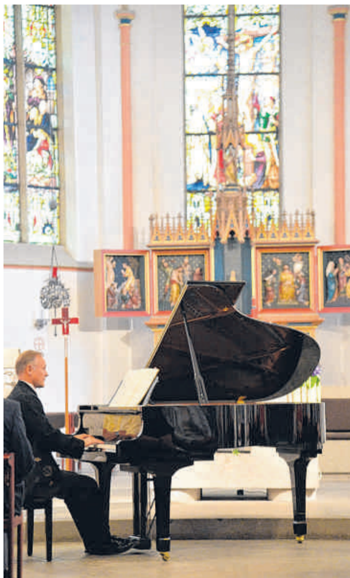
Pianist und Komponist Falko Steinbach spielte auch im vorigen Jahr in der Konzertreihe in Sankt Nikolaus Dürscheid.